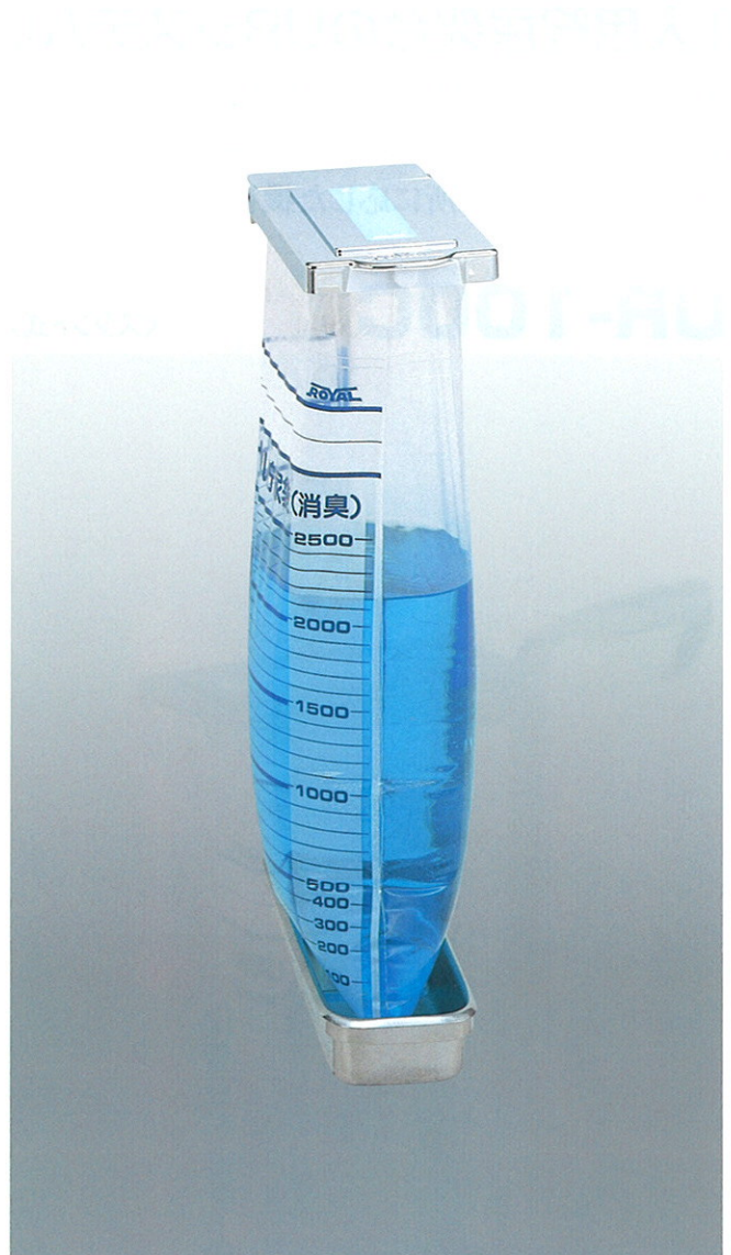
※写真は(R)タイプです。 W250×D135×H390 ※UR-100Aは右側取付タイプの(R)と左側取付タイプの(L)の2種類があります。